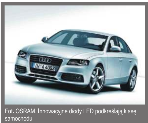
Fot. OSRAM. Innowacyjne diody LED podkreślają klasę samochodu

Firma OSRAM jest głównym partnerem dla wszystkich światowych producentów pojazdów mechanicznych, dostarczając do nich źródła światła oraz diody LED. Swoją pozycję zawdzięcza nowoczesnej technologii produkcji, innowacyjnym rozwiązaniom oraz niezawodnej jakości wytwarzanych produktów. Ponadto OSRAM cały czas monitoruje oczekiwania konsumentów dostosowując swoje produkty do ich oczekiwań.